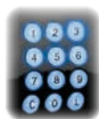
Tastiera retroilluminata Clavier rétroéclairé Backlit keyboard