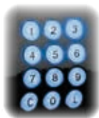
Tastiera retroilluminata Clavier rétroéclairé Backlit keyboard